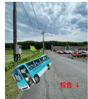
「北広島駅東口」乗り場 「星槎道都大学」乗り場