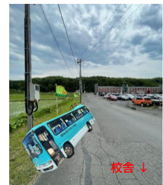
「北広島駅東口」乗り場 「星槎道都大学」乗り場